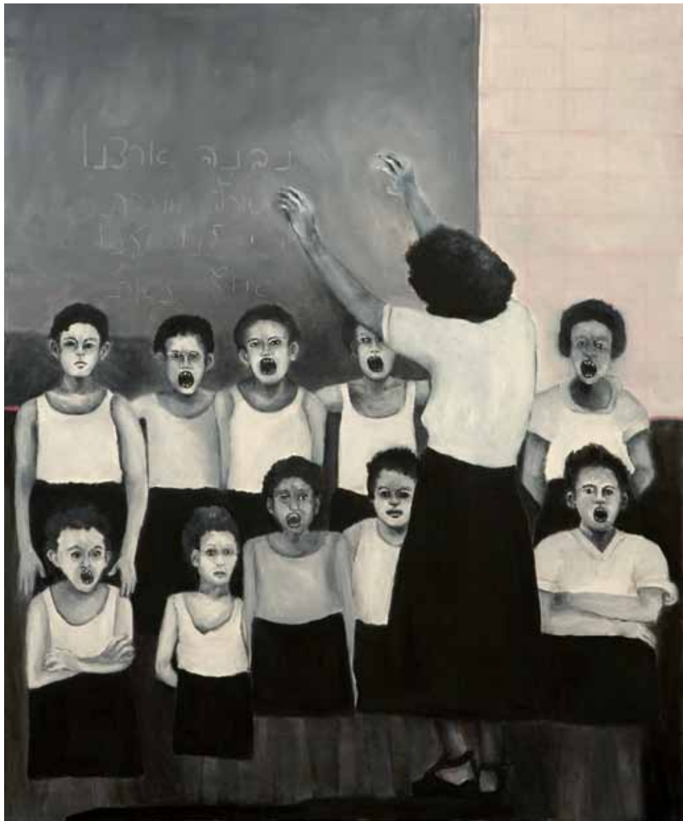
נבונה ארצנו (המקהלה), 2009, אקריליק וצבע שמן על בד, 120x90 We'll Build Our Country (The Choir), 2009, acrylic and oil paint on canvas, 120x90