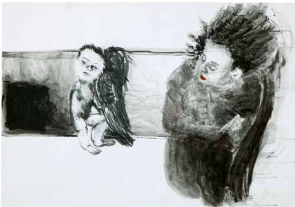
מורה וילד, 2010, רישום דיו, אקריליק ופחם סינתטי על נייר, 70x100 Teacher and Child, 2010, ink drawing, acrylic and synthetic charcoal on paper, 70x100