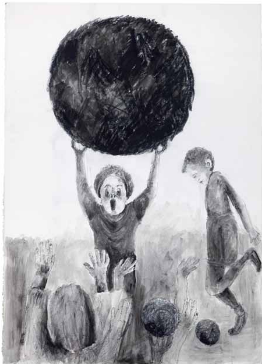
משחקי ילדים (הפסקה), 2010, רישום דיו, אקריליק וגירים על נייר, 100x70 Children Games (break), 2010, ink drawing, acrylic and chalk on paper, 100x70