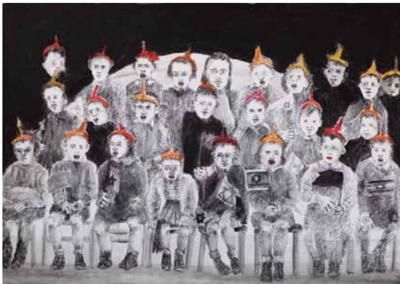
נרות, ספרים ודגלים (דיפטיכון), 2011, רישום דיו, אקריליק וקולאז' על בד, 50x70 כל אחד Candles, Books and Flags (Diptych), 2011, ink drawing, acrylic and collage on canvas, 50x70 each