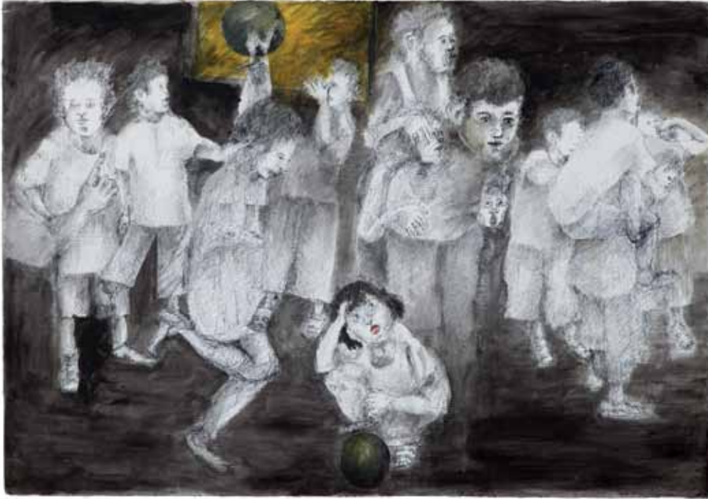
משחקי ילדים (רחוב), 2011, רישום דיו ואקריליק על נייר, 80x110 Children's Games (street), 2011, ink drawing and acrylic on paper, 80x110