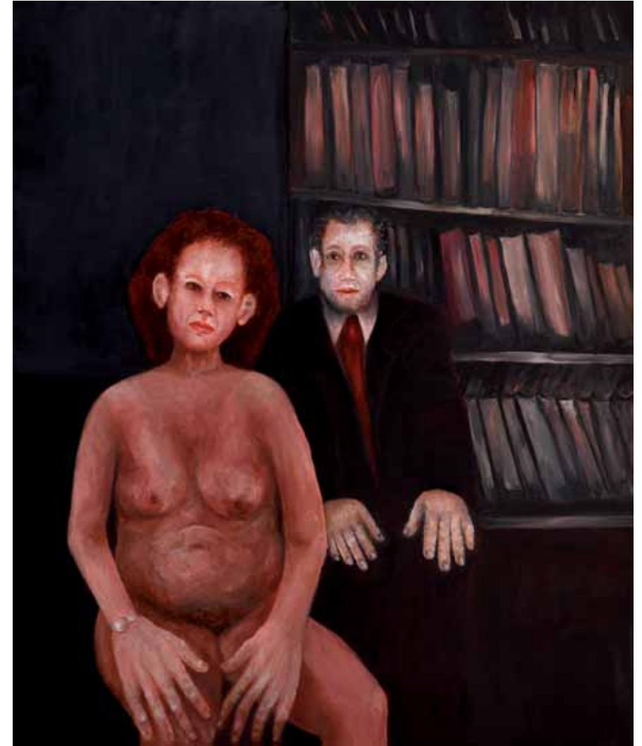
בספרייה, 2010, שמן על בד, 112x100 At the Library, 2010, oil on canvas, 112x100