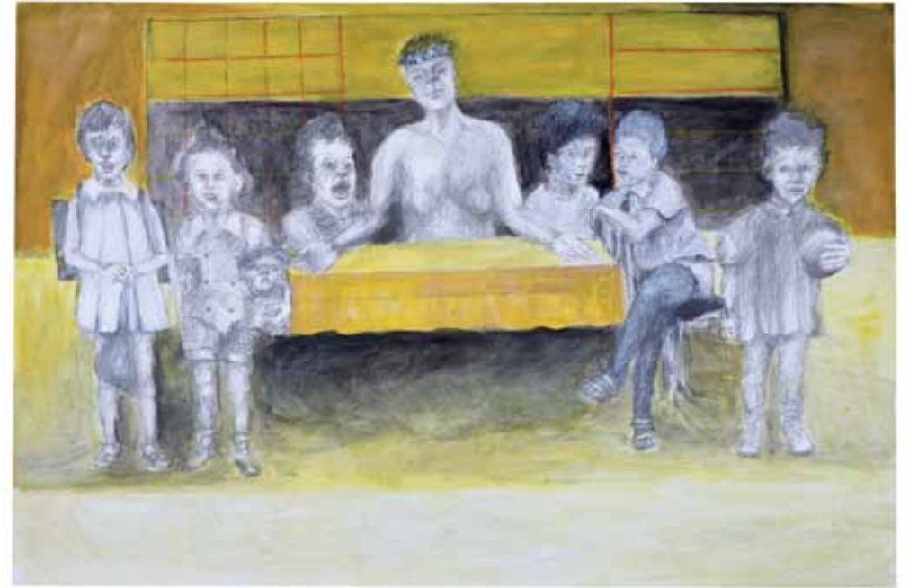
סעודה אחרונה 4, 2009, עיפרון, דיו ואקריליק על נייר, 70x100 Last Supper 4, 2009, pencil, ink and acrylic on paper, 70x100