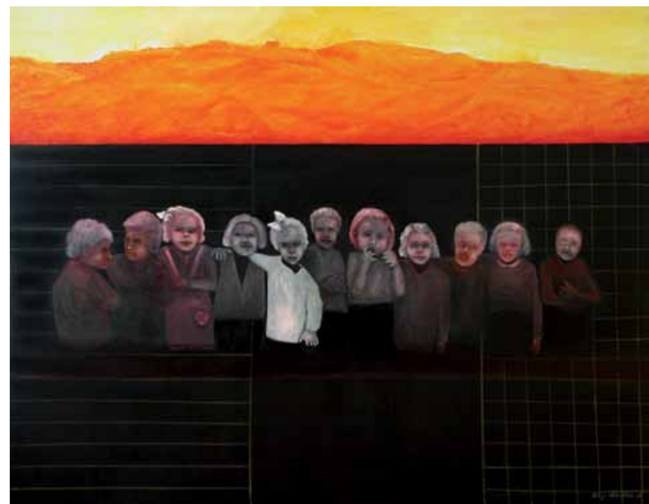
סעודה אחרונה 2, 2009, רישום דיו, אקריליק וצבע שמן על נייר, 160x210 Last Supper 2, 2009, ink drawing, acrylic and oil paint on paper, 160x210