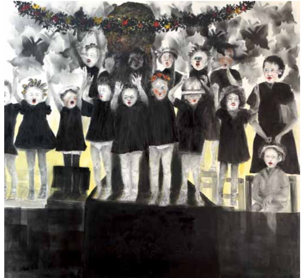
לכו בעקבותיי 3, 2011, רישום דיו, אקריליק וגירים על בד, 70x50 Follow Me 3, 2011, ink drawing, acrylic and chalk on canvas, 70x50