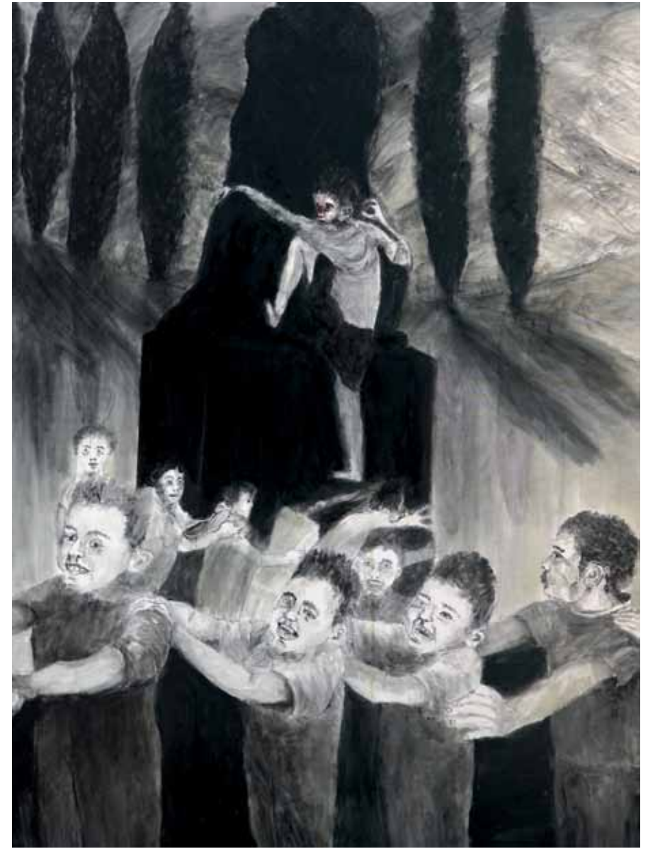
בלבב פנימה (ההמנון), 2010, רישום דיו ואקריליק על נייר, 100x70 In the Heart, Within (The Anthem), 2010, ink drawing and acrylic on paper, 100x70