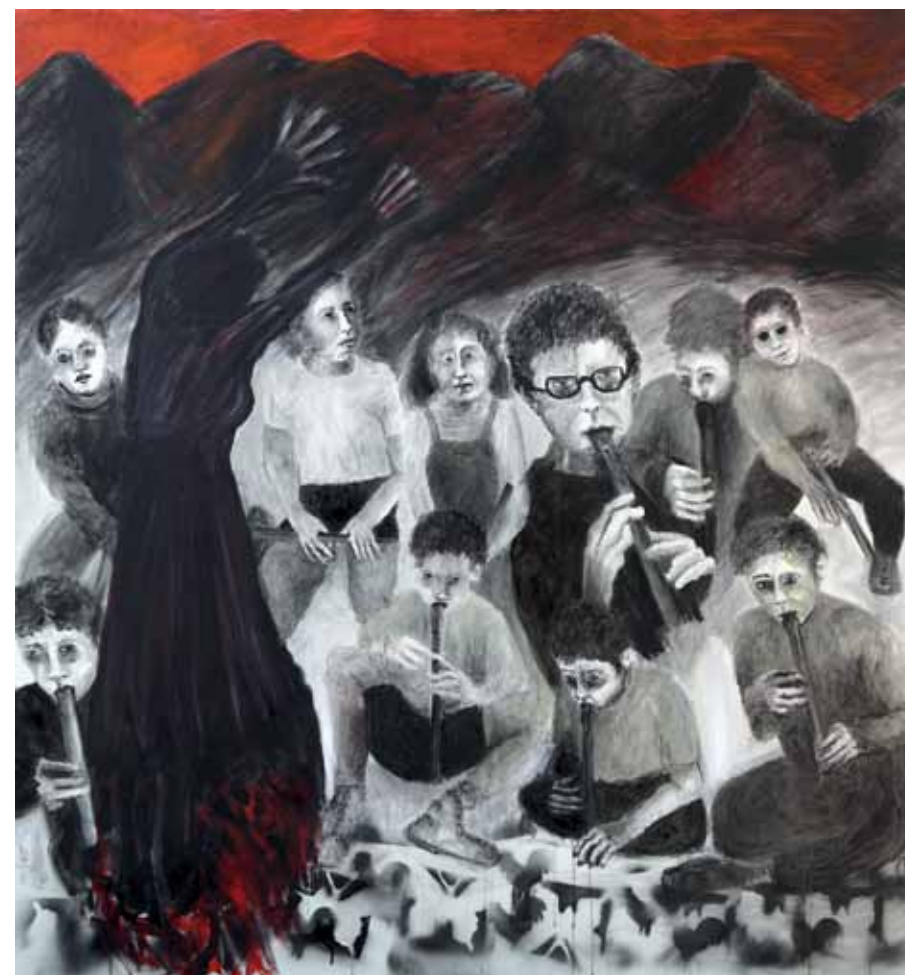
חליליות, 2011, רישום דיו, אקריליק, צבע שמן והדפסות על בד, 160x150 Recorders, 2011, ink drawing, acrylic, oil paint and prints on canvas, 160x150