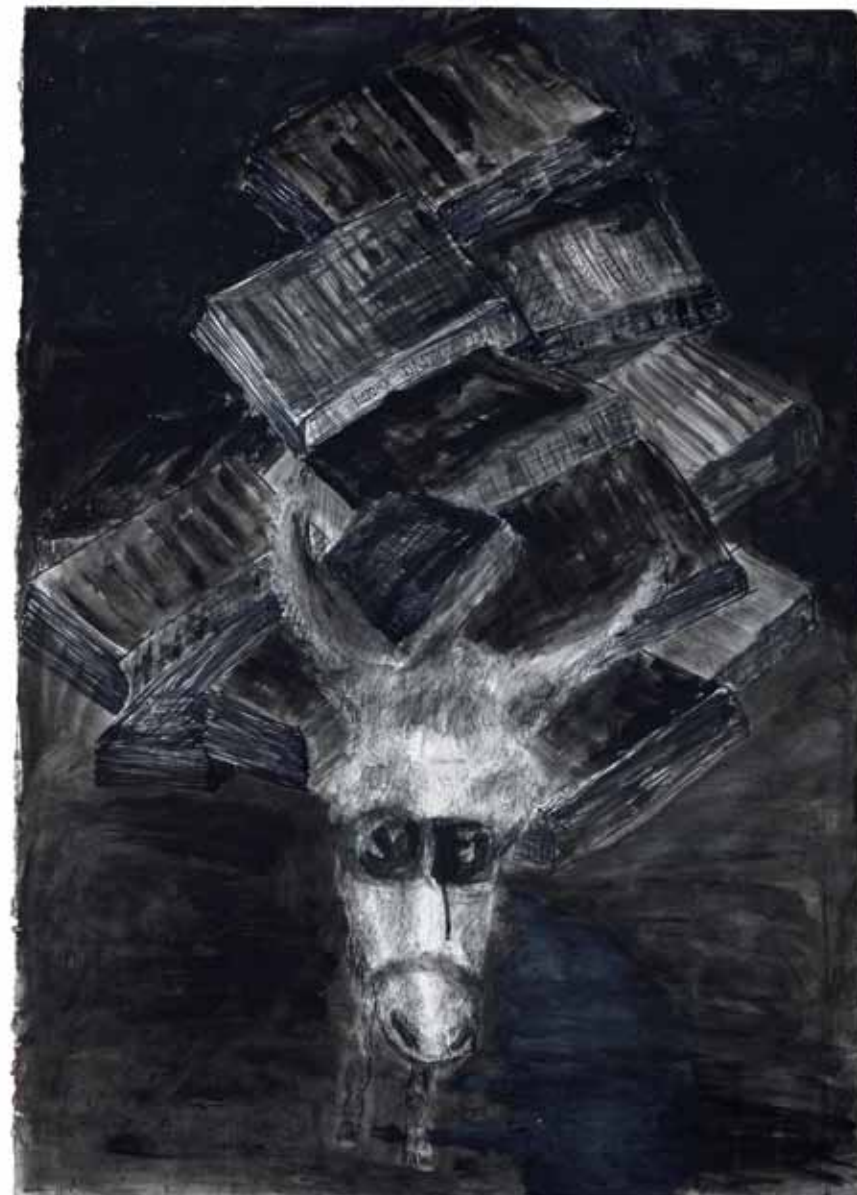
המורה, 2011, רישום דיו, אקריליק וקולאז' על נייר, 100x70 The Teacher, 2011, ink drawing, acrylic and collage on paper, 100x70