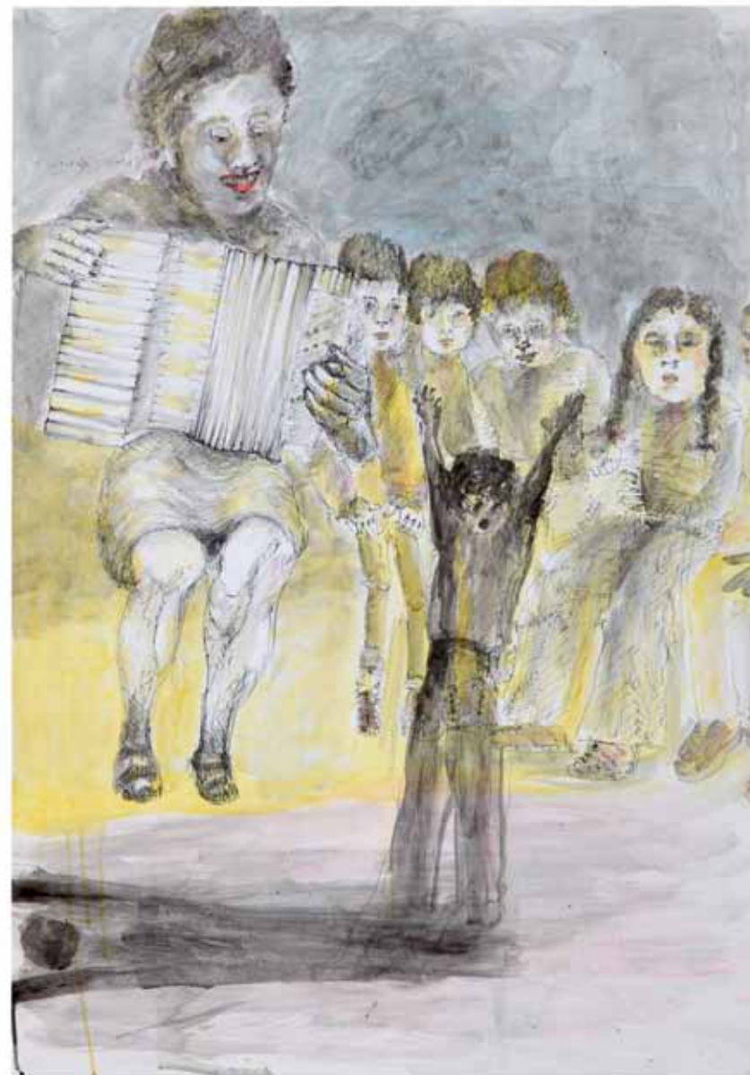
ילד שר וצל, 2011, רישום דיו ואקריליק מדולל על נייר, 100x70 Singing Boy and His Shadow, 2011, ink drawing and diluted acrylic on paper, 100x70