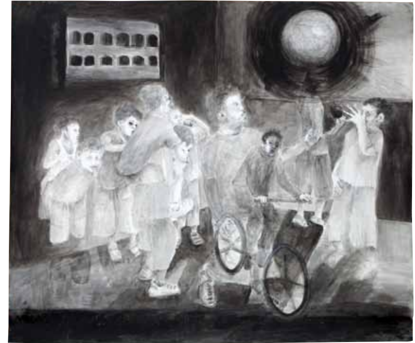
משחקי ילדים (בניין בית ספר), 2011, רישום דיו ואקריליק על נייר, 160x200 Children's Games (school building), 2011, ink drawing and acrylic on paper, 160x200