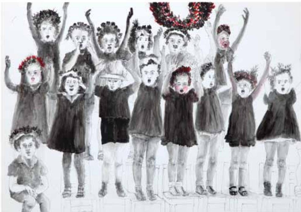
הנפה, 2010, רישום דיו ואקריליק על נייר, 80x110 Lifting, 2010, ink drawing and acrylic on paper, 80x110