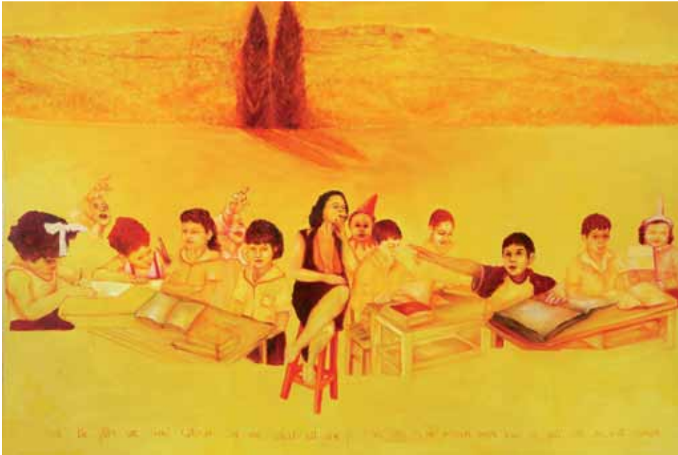
סעודה אחרונה 1, 2005, שמן על בד, 155x240 Last Supper 1, 2005, oil on canvas, 155x240