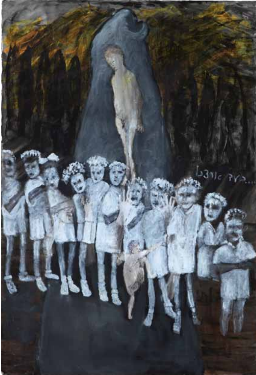
לכו בעקבותיי 4, 2011, רישום דיו ואקריליק על נייר, 100x80 Follow Me 4, 2011, ink drawing and acrylic on paper, 100x80