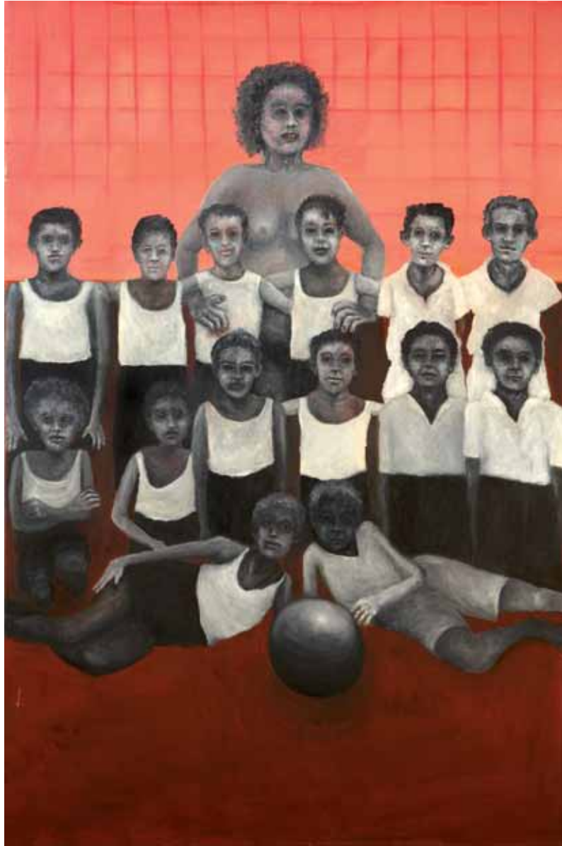
קבוצת כדורגל, 2007, שמן על בד, 150x100 Football Team, 2007, oil on canvas, 150x100