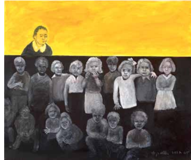
טיול שנתי 1, 2004, שמן על בד, 60x70 Field Trip 1, 2004, oil on canvas, 60x70