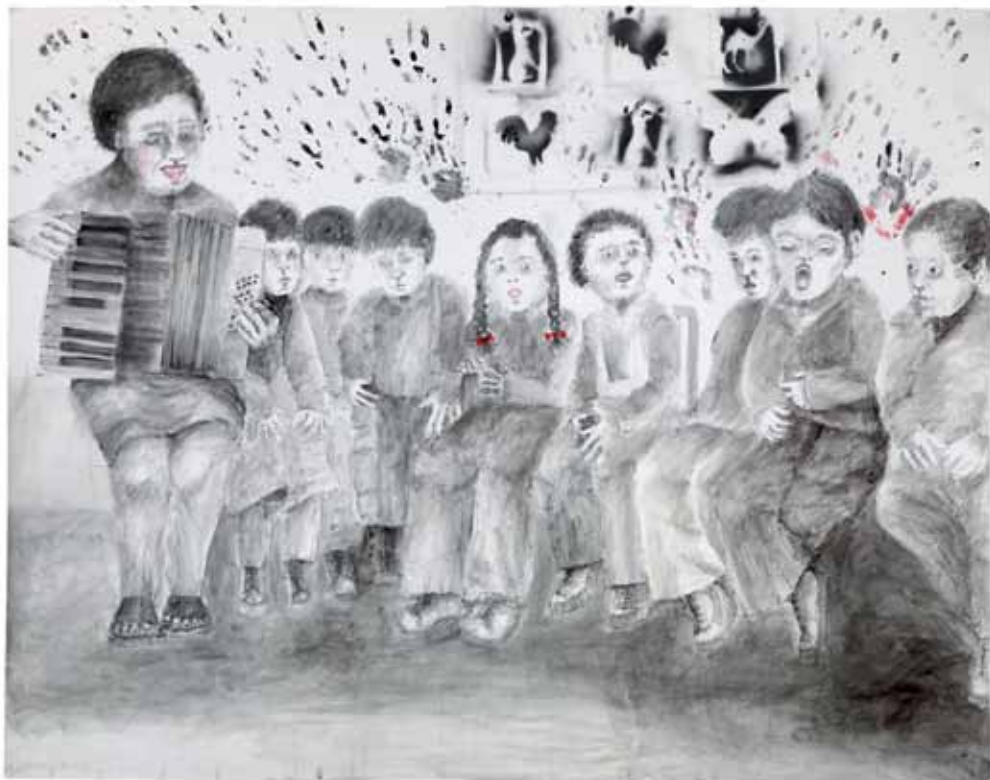
אקורדיון, 2011, רישום דיו, אקריליק והדפסות על נייר, 120x152 Accordion, 2011, ink drawing, acrylic and prints on paper, 120x152