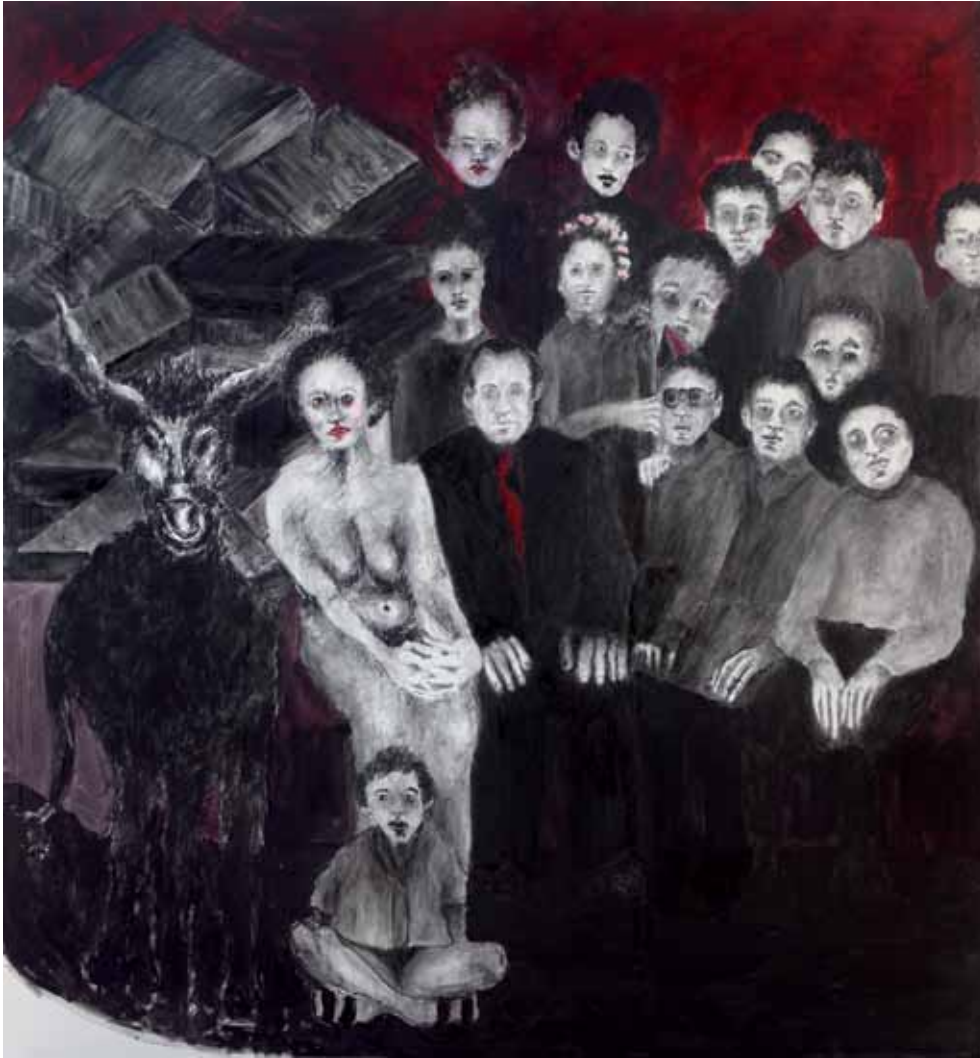
צילום סוף שנה עם חמור, 2011, רישום דיו, אקריליק וצבע שמן על בד, 160x150 Yearbook Photo with a Donkey, 2011, ink drawing, acrylic and oil paint on canvas, 160x150