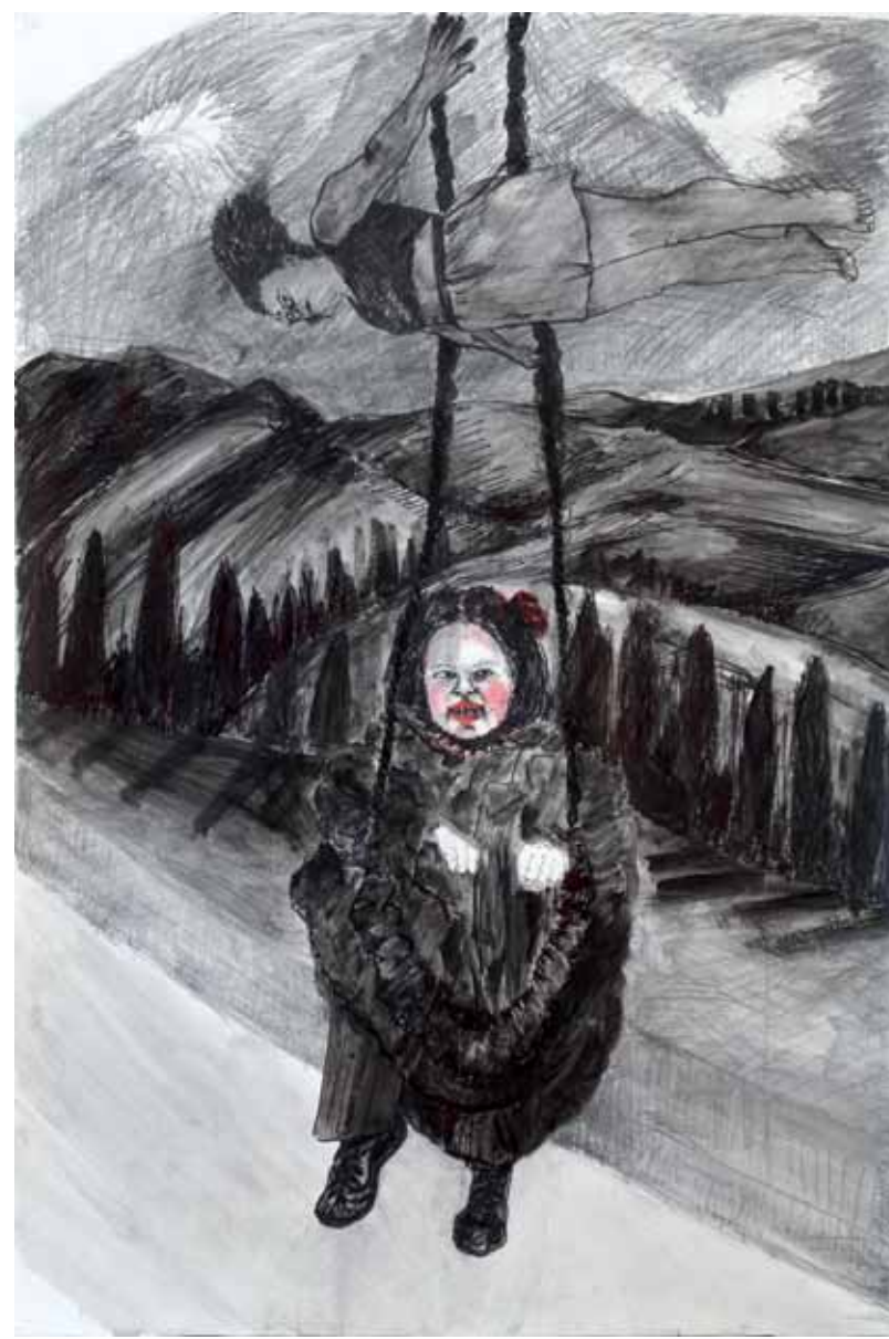
נדנדה, 2009, רישום דיו ואקריליק על נייר, 100x70 Swing, 2009, ink drawing and acrylic on paper, 100x70