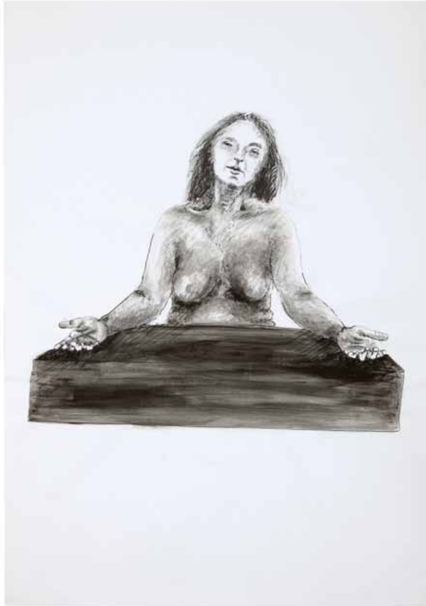
המורה, 2011, רישום דיו ואקריליק על נייר, 100x70 The Teacher, 2011, ink drawing and acrylic on paper, 100x70