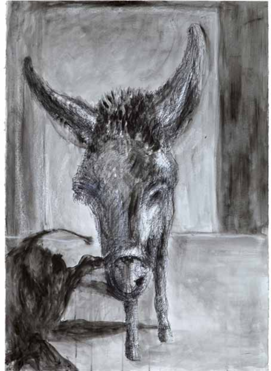
בספרייה, 2009, רישום דיו ואקריליק על נייר, 110x80 At the Library, 2009, ink drawing and acrylic on paper, 110x80